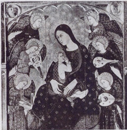
Col·lecció Plandiura. — «Mare de Déu de la Llet». Segle XIV Escola catalana

d'un tal Jacobus que amb tal obra es classifica un mestre retauler; un retaule procedent de Gelida; altre de Santa Coloma de Queralt; i una deliciosa Mare de Déu alletant l'Infant, que procedeix d'Estopyan.