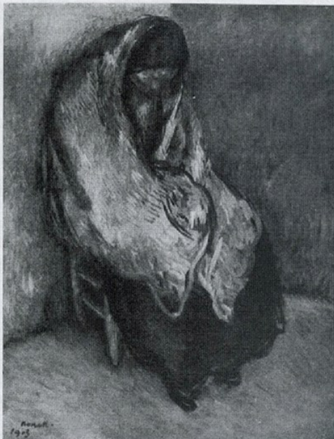
Col·lecció Plandiura. — Nonell — «Gitana»

I així s'ha aconseguit una de les més belles col·leccions escultòriques dels segles XII al XV.