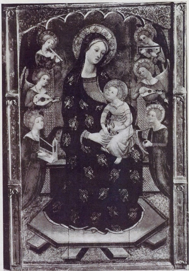
Col·leccio Plandiura. — «La Mare de Déu de la Llet». Obrador dels Serra. Segles XIV-XV