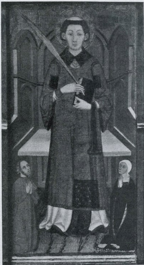
Col·lecció Plandiura. — Fragment d'un retaule dels inicis del segle XV. Obrador dels Serra

faltan 1 faltan 2 faltan 3 faltan 2 faltan 3