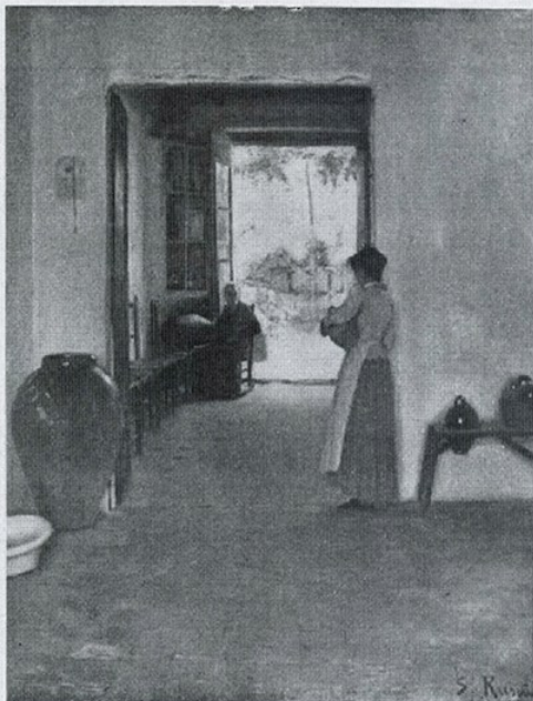
Col·lecció Plandura. — S. Rusiñol. — Interior

grat semblar guardar un parentesc amb la ceràmica de Montelupo, caldria estudiar-la bé per a poder reivindicar-la com a nostra.