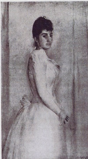
Col·lecció Plandiura. — S. Basilio. — Retrat