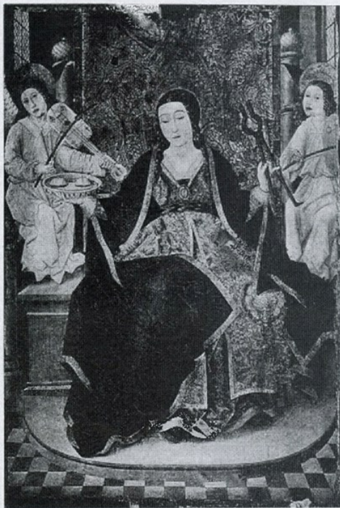
Col·lecció Plandiura. — Taula d'escola catalano-aragonesa. Segle XV

nenques. D'entre els retaules que completen la sèrie romànica de la secció, cal esmentar el de santa Úrsula, que és el que sembla més antic, car se'l pot cronologar en el darrer terç del segle XIII, i la història dels apòstols Pere i Pau, procedent d'Oscà, que fou el que la infanta Elionor de Castella féu present al seu marit Alfons IV d'Aragó, per allà l'any 1330.