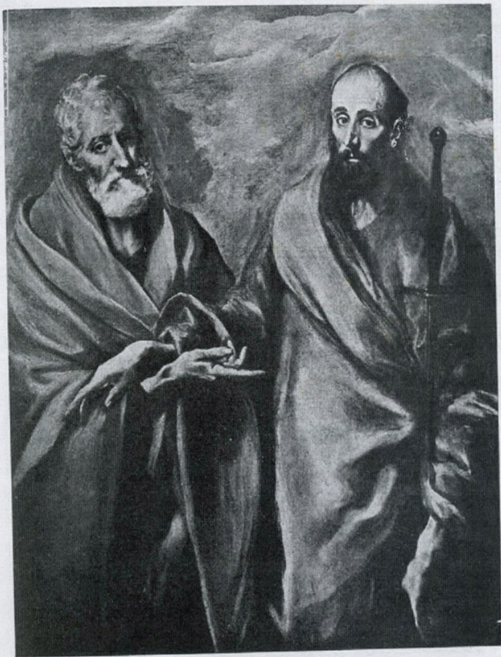
Col·lecció Plandiura. — «El Greco». — «Sant Pere i sant Pau»