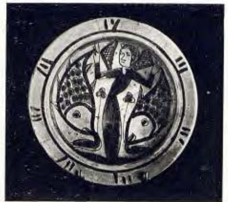
Tres plates de fabricació valenciana (Manisses). Segle XIV