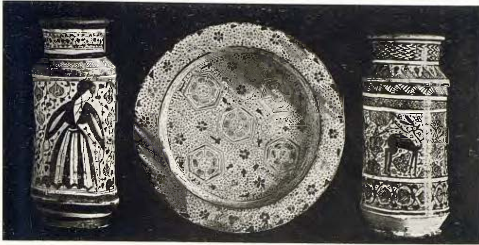
Dos pots de farmàcia i una plata. Fabricació valenciana (Manisses). Segle xv