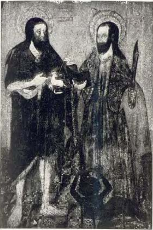
Sant Joan Baptista i Sant Bartomeu; pintura sobre fusta - Segle xv 28