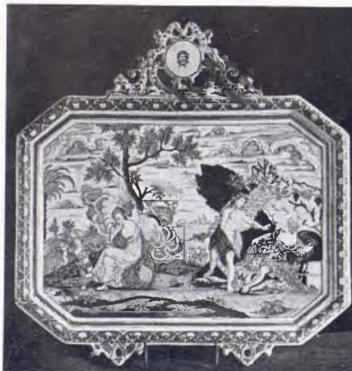
Quadro de sobre-parador (Alcora). Segle xviii