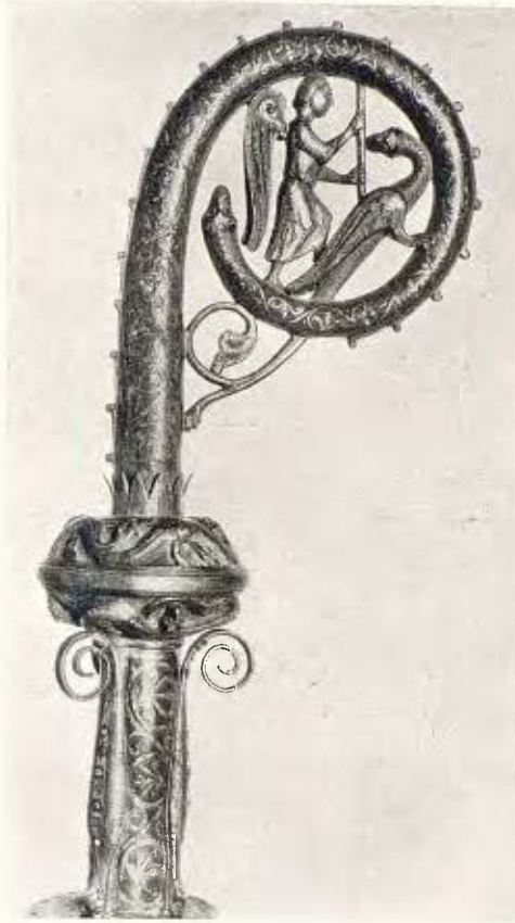
Bàcul episcopal de don Peiayo, bisbe de Mondoñedo; obra llemosina de finals del segle XII 42