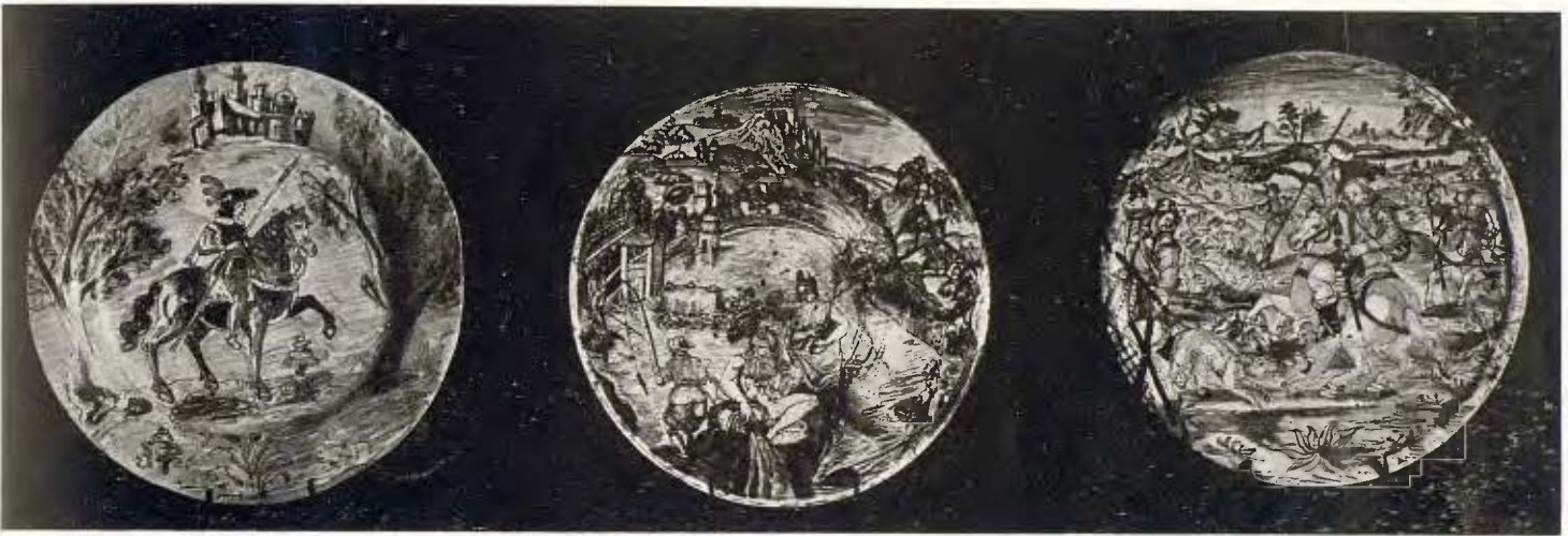
Tres plates de fabricació castellana (Talavera). Segle xvii