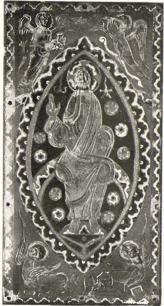
El Pantocràtor en placa d'esmalt de Limoges - Segle XIII 20

d'art popular endarrerit i conservador de disposició tradicional.