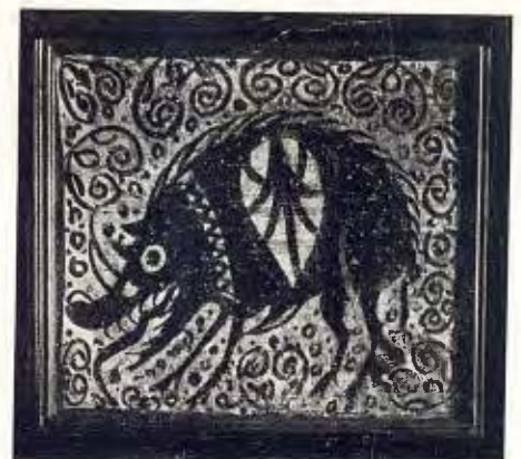
Tres casetons ceràmics d'enteixinat (Socarrats) Fabricació valenciana. Segle XV