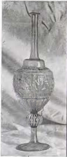
Ampolla catalana. Segle xvi-xvii