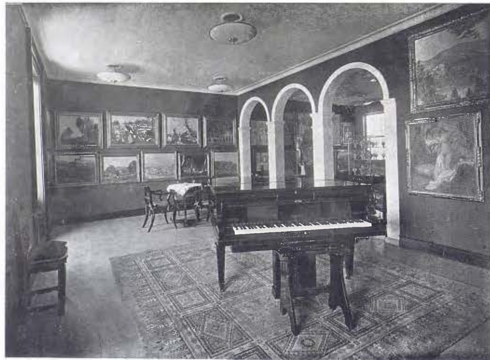
Una sala del Museu d'art modern