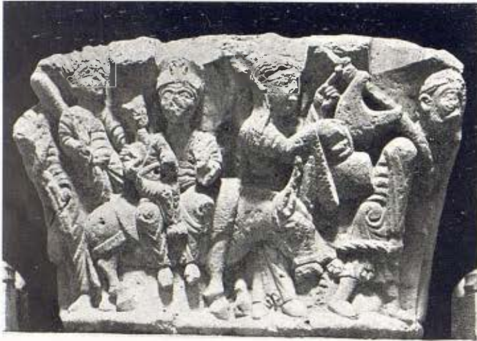
La Fugida a Egipte. Capítell en pedra - Segle XI