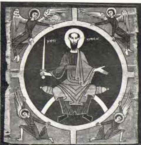
Cimbori de Sant Pau - Segle XIII