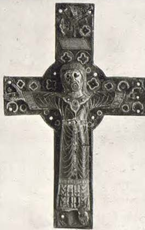
Creu i Crucifix-Majestat; obra llemosina del segle XIII 43