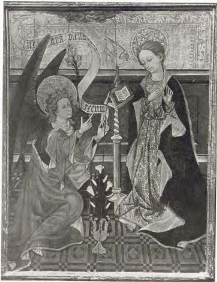
L'Anunciació; taula d'escola valenciana - Segle xv 37