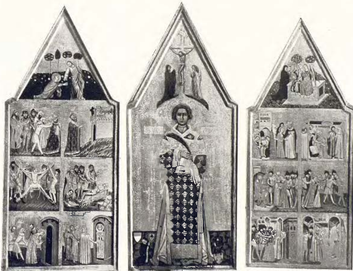
Retaule de Sant Vicents Diacon; obra italiana del segle XIV