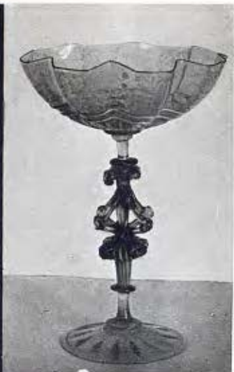
Copa catalana. Segle xvii