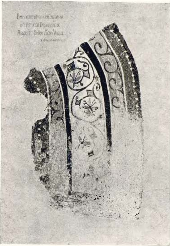
Pintura mural romànica d'Argolell - Segle XII