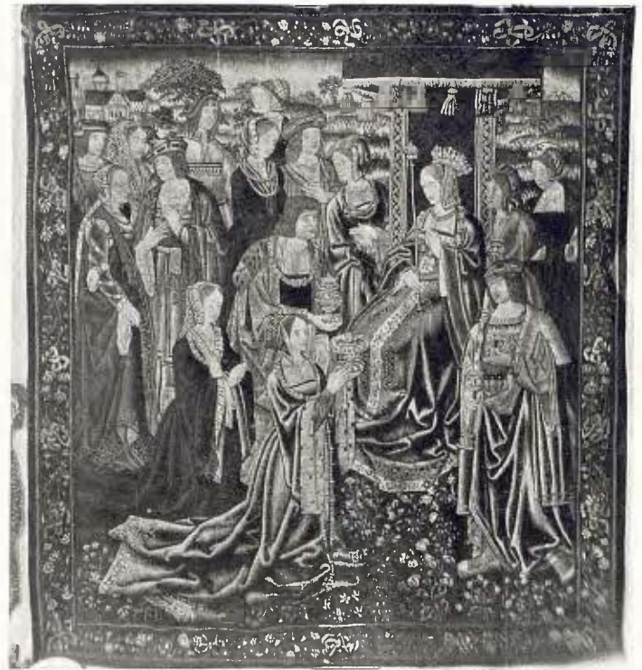
Asuero Esther, drap d'Arràs - Darreries del segle xv 38