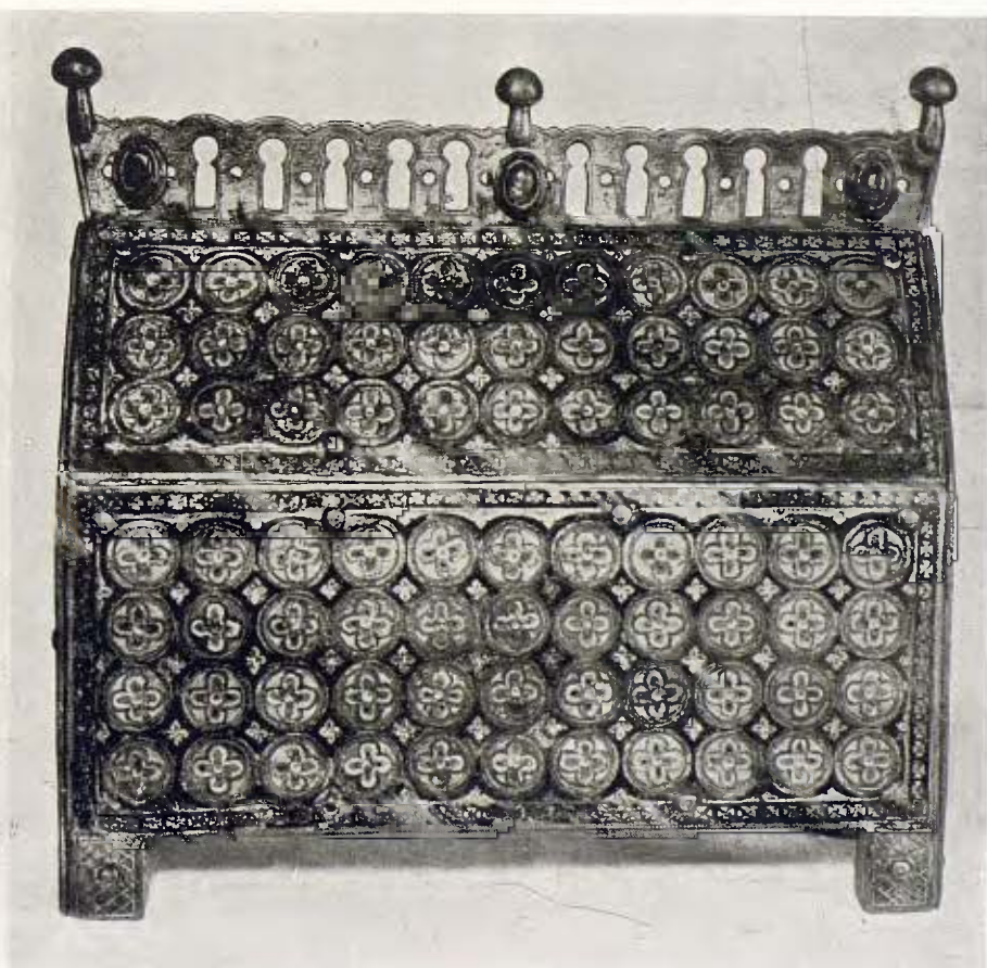
Arqueta de relíquies; obra llemosina del segle XIII 45