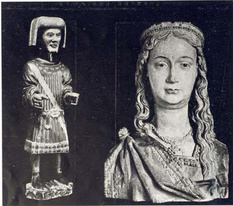
Un sant metge en escultura en fusta policromada - Segle xv 21