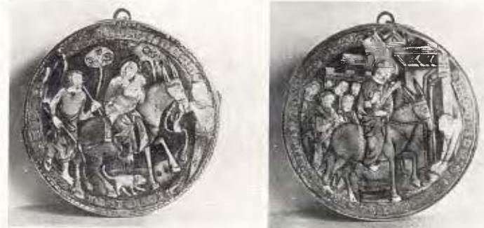
La Fugida a Egipte i Entrada de Crist a Jerusalem, caps de mirall en esmalt transparent - Obra francesa del segle xv 39