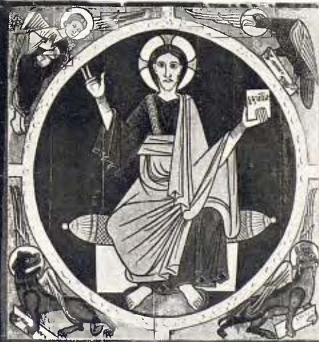
Cimbori del Pantocràtor - Segle XIII