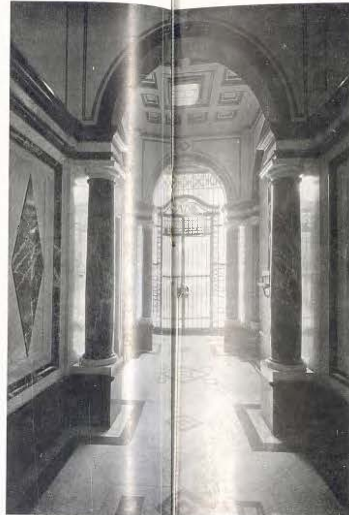
Entrada de la casa (Pintura de Joan Miró)