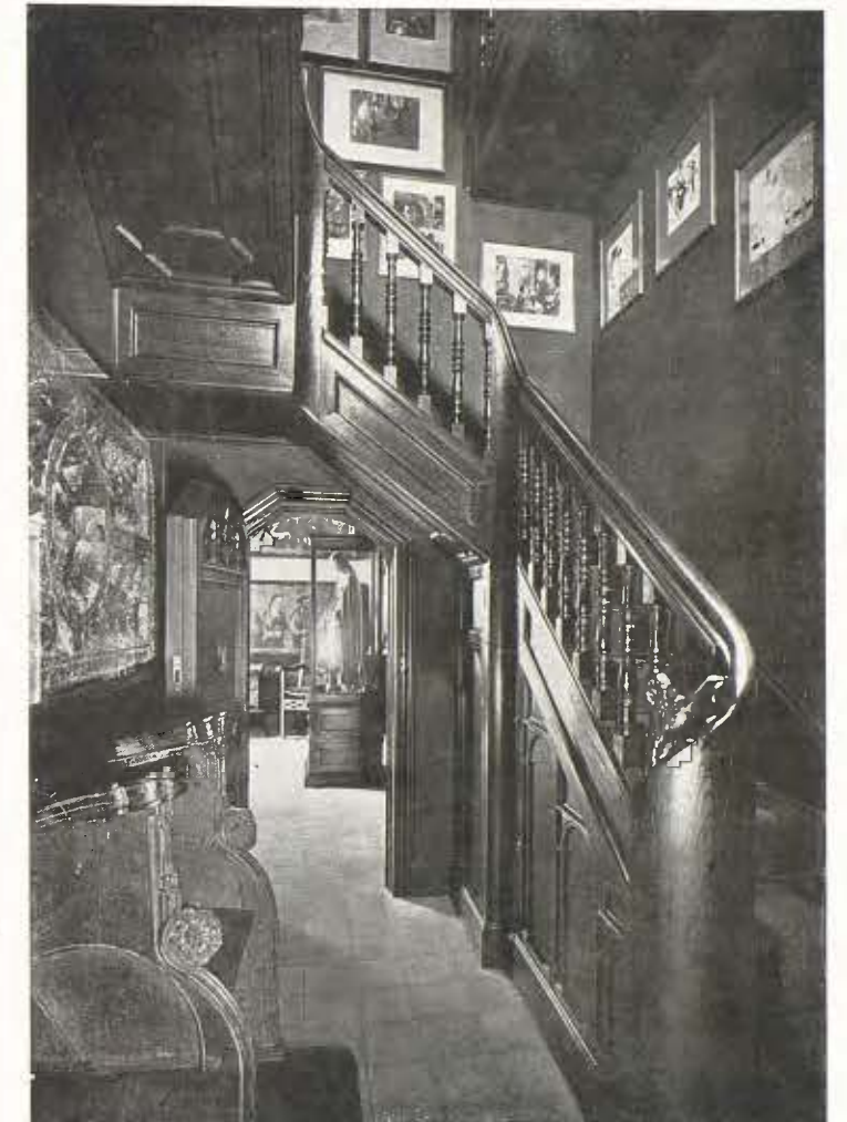
Escala que condueix a la col·lecció d'art modern