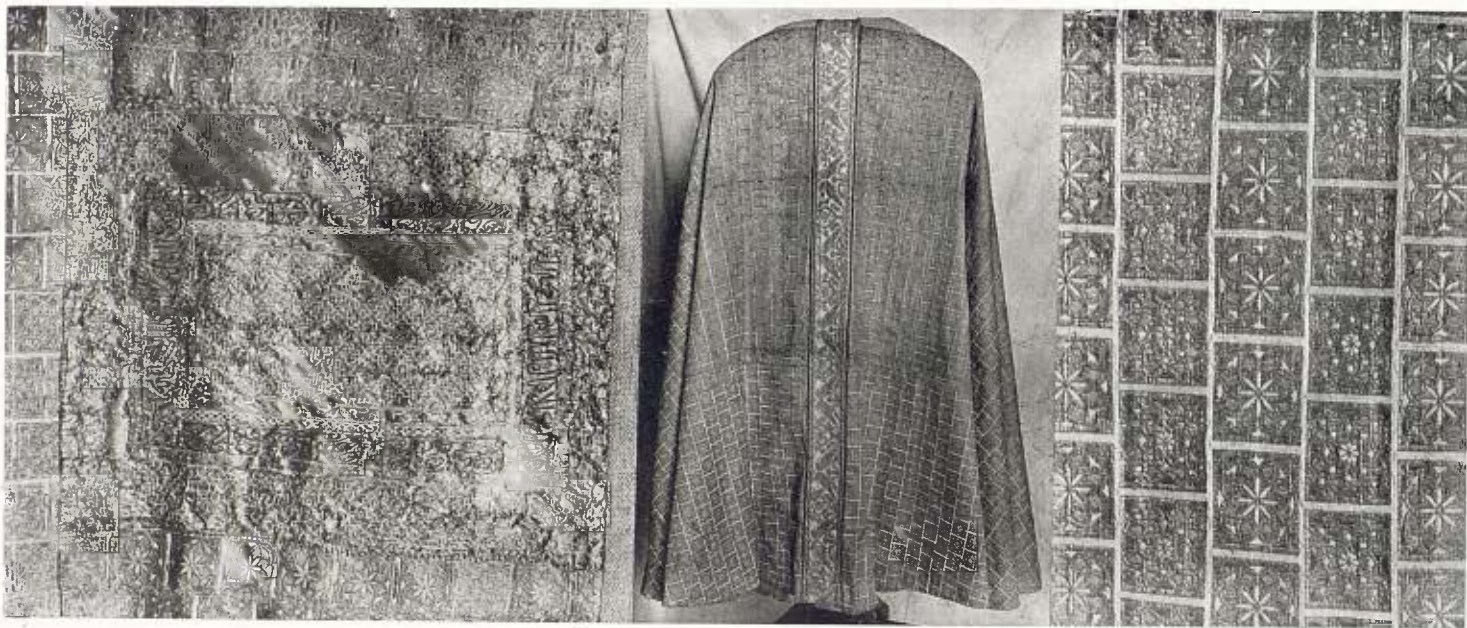
Detalls del tern de Sant Valeri - Segle XIII

presentades les peces de reflex metàl·lic de la regió valentina, no faltant-hi bells exemplars de blau, verd i manganès dels forns de Manisses, Paterna i Carcer, tan recomanats i dels quals féu l'apologia el nostre mestre Francesc Eximenis per allà els anys de 1380. Relativament més important és encara la vaixel·la sortida de les comarques aragoneses i classificada com a producció de Terol i Muel, vidriades sobre verd i color vinós, alguna vegada tocats amb traços de reflex metàl·lic. Tal sèrie aragonesa té peces d'un gran valor, podent-se dir que avui resulta impossible de superar-la i que hi hagi qui pugui adquirir una sèrie de tan alt interès com és la del senyor Plandiura. En aquestes gerres, conques, pots de farmàcia, mesures vineres, plats, etc., en llur mateix dibuix brutalment interpretat, un hom no deixa de copsar-hi exquisideses d'una sinceritat i ingenuïtat adorables.