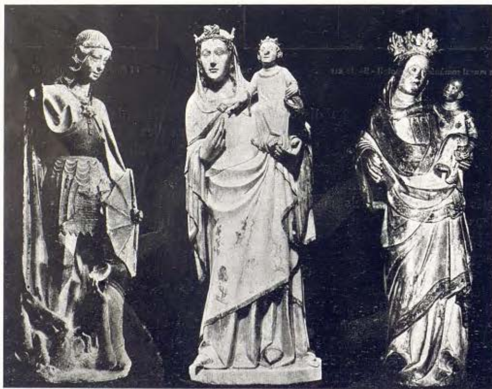
Sant Miquel Arcàngel en terra cuita, obra casteliana - Segle xv 23