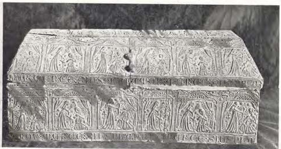
Arqueta amatòria amb una llegenda catalana - Segle xv 41