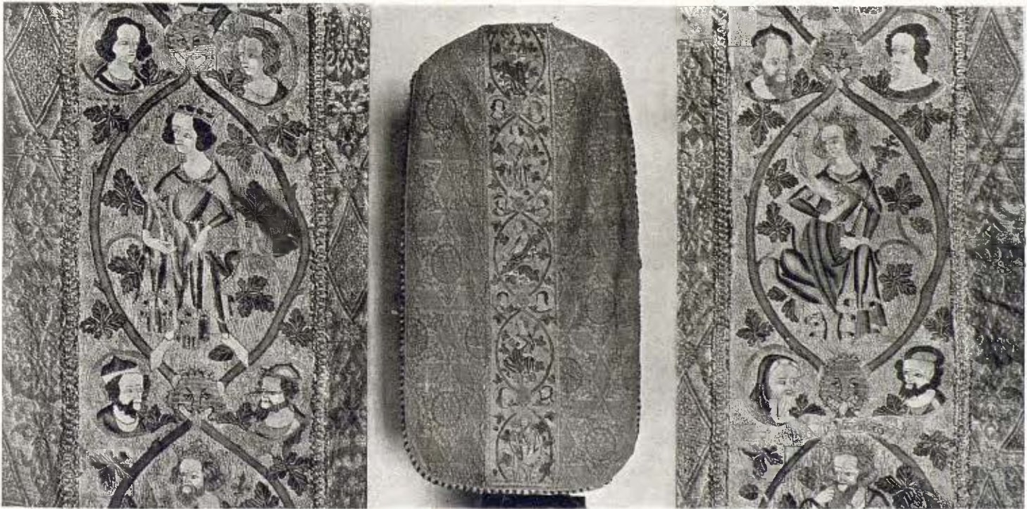
Casalla de Sant Vicens i detalls de la mateixa, amb brodats anglesos - Segle XIV