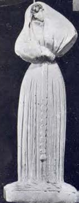
La Bon Plantada. Fabricació alcorana Finals del segle xviii