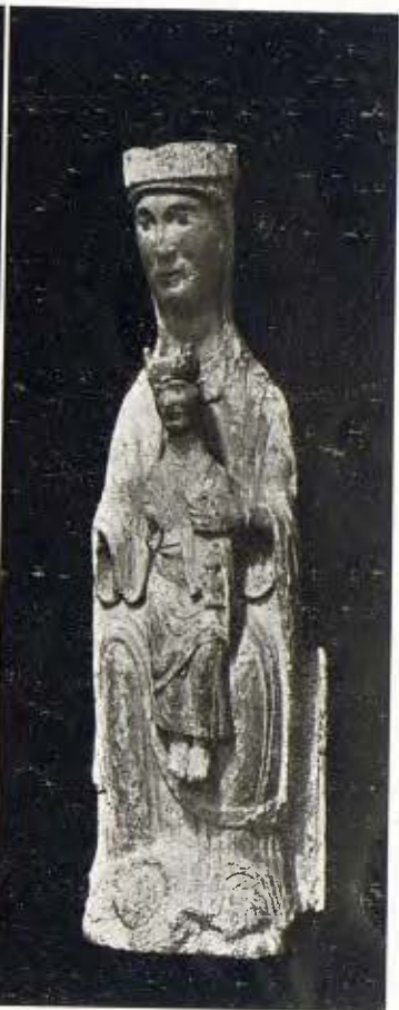
Mare de Déu en fusta policromada 4 Segle XIV