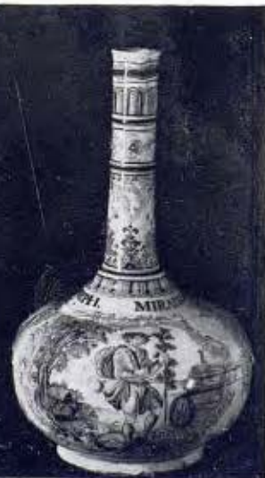
Ampolla de ceràmica (Alcora). Segle xviii