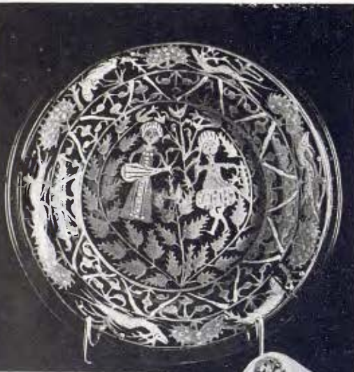
Plat de vidre català esmaltat. Segle xvi