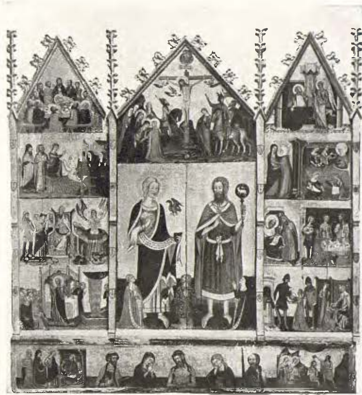
Retaule de Sant Joan Baptista i Sant Joan Evangelista; obra italianitzant sobre fusta - Segle XIV 29