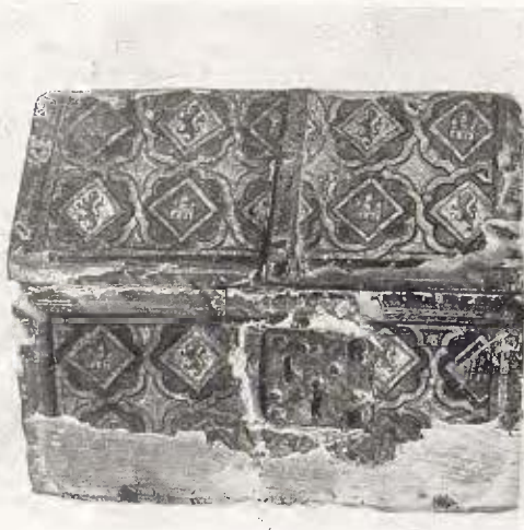
Arqueta per a relíquies, de fusta policromada - Segle xiv 40