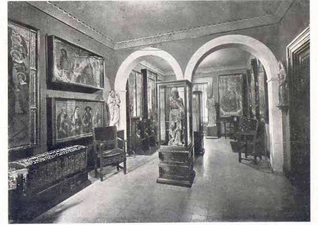
Una sala del Museu d'art antic (art gòtic)