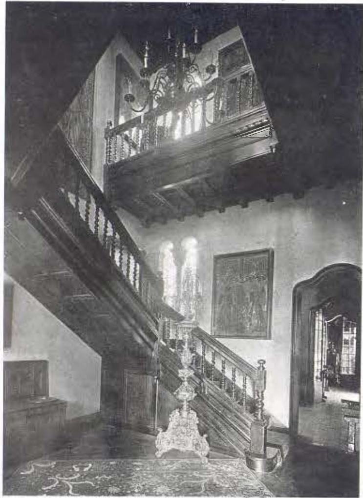
Escala que condueix al museu