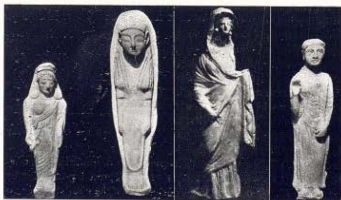
Terres cuites ebussitanes - Segle v-III (a. J. C.)