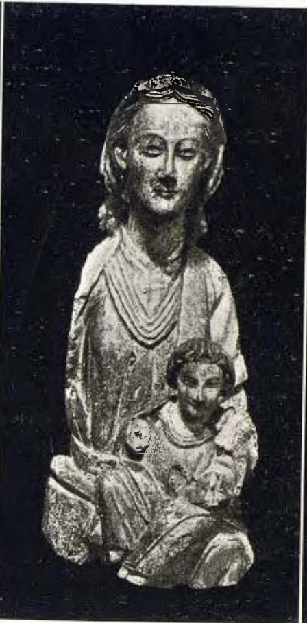
Mare de Déu en fusta policromada 3 Segle XII