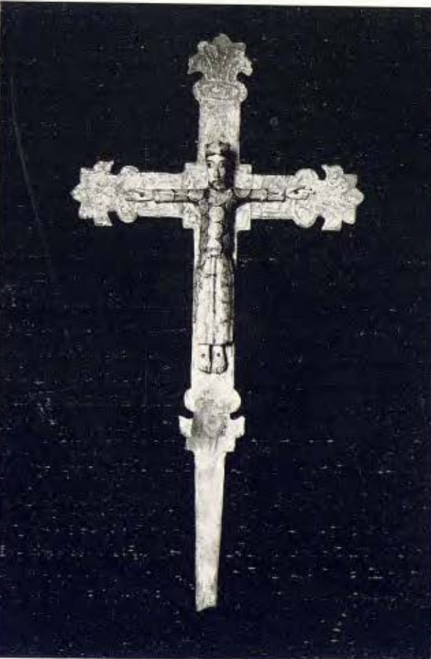
Majestat en fusta policromada 6 Segle XIV