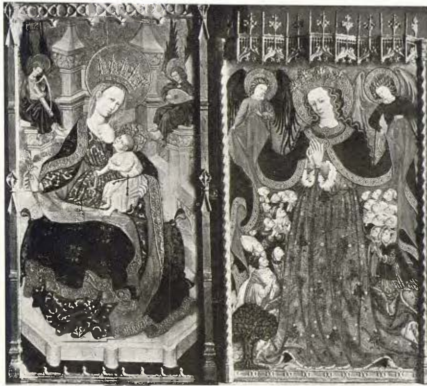
La Mare de Déu de la Llet, taula aragonesa 33 Segle xv