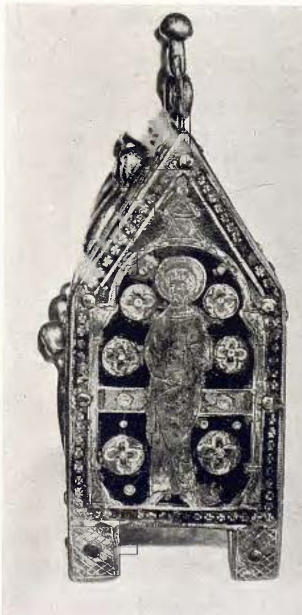
Arqueta de relíquies; obra llemosina segle XIII 44