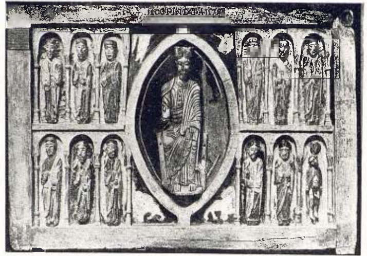
Pallis de fusta tallada amb el Pantocràtor i l'Apostolat - Segle XII

particulars, sinó també pels museus de fama mundial.