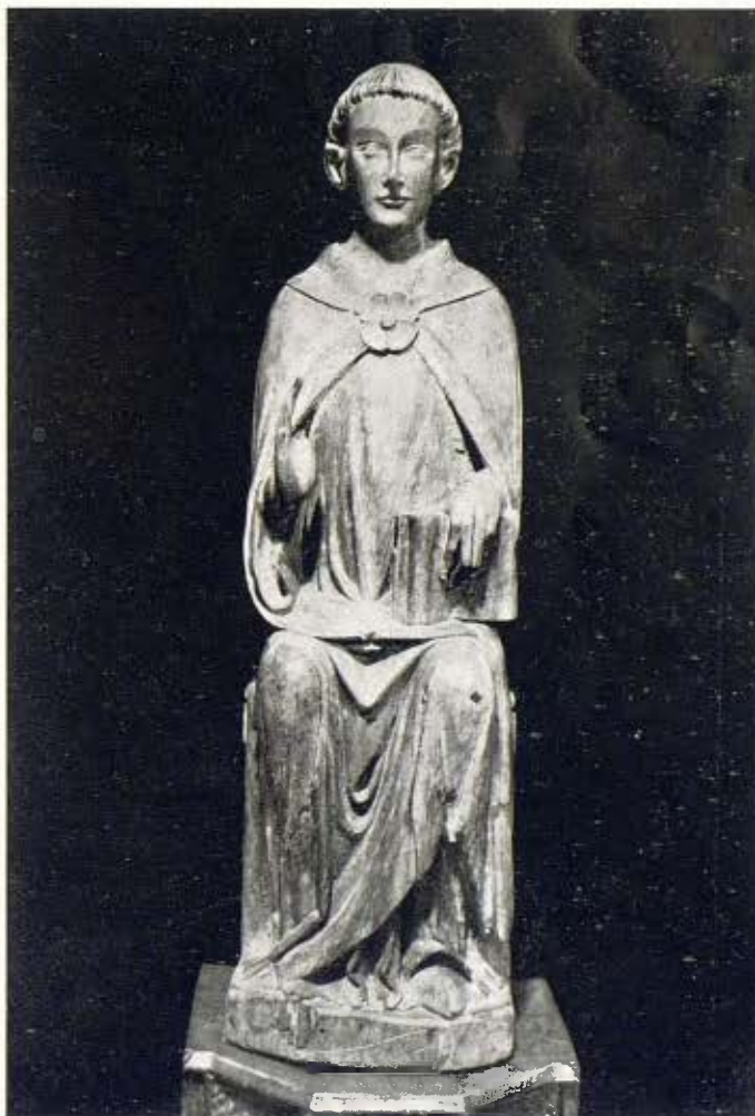
Un sant en fusta tallada - Segle XIV

Completen les anteriors al·lusions al cruent drama del Gòlgota sis figures pertanyents a dos conjunts referents al Davallament de la Creu, segons la modalitat iconogràfica, típica en la regió ponentina de la nostra terra i que en les valls de Bohí i Tahull ha donat notable collita després que en l'any 1907 l'Institut d'Estudis Catalans hi trameté una comissió ex-