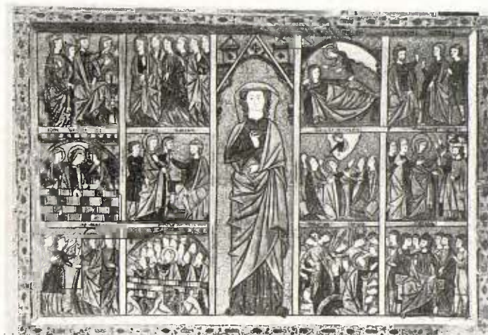
Retaule aragonès de Santa Ursula - Segona meitat del segle XIII

ge i el Nen i una placa de la mateixa matèria i època, donant en relleu el sacrifici del Calvari.