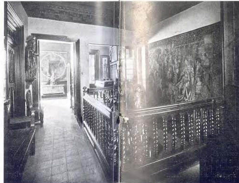
Galeria de pas del Museu d'art antic