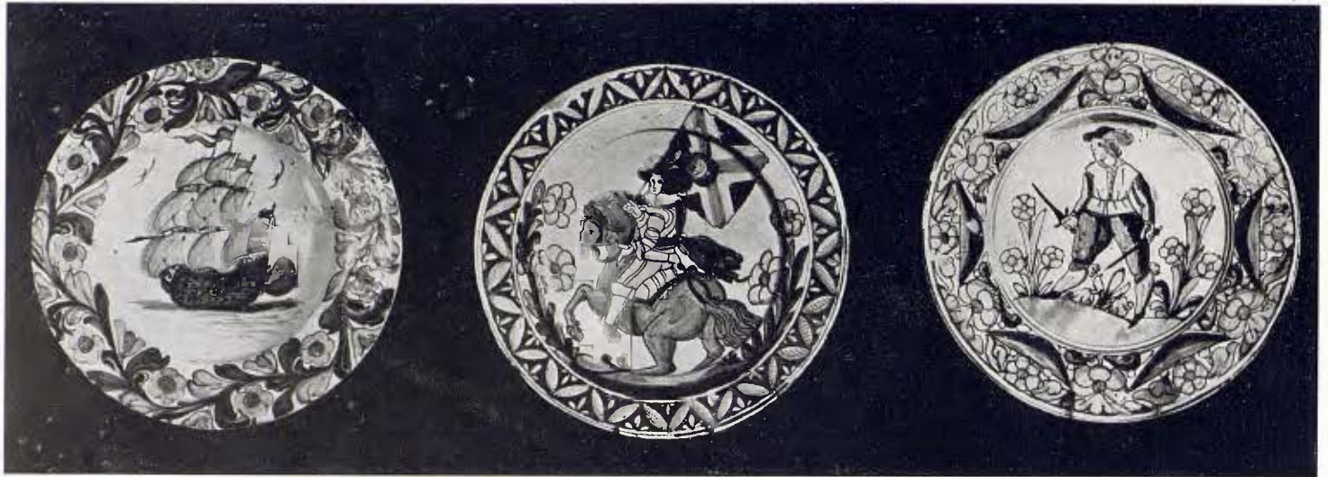
Tres plates de fabricació catalana. Segle xvii