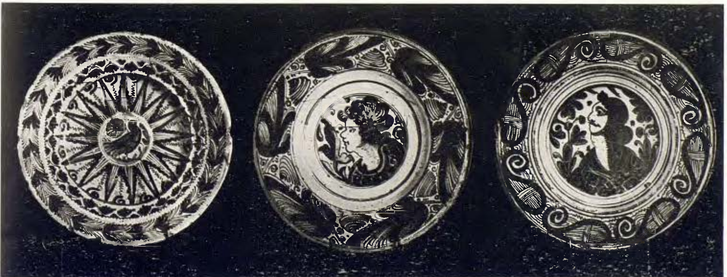
Tres plates de fabricació catalana. Segle xvii