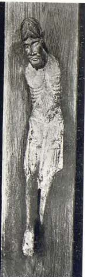
Crucifix en fusta policromada 7 Segle XIII