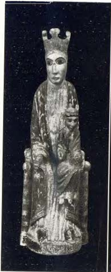
Mare de Déu en fusta policromada 2 Segle XIII