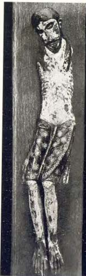
Crucifix en fusta policromada 5 Segle XIII