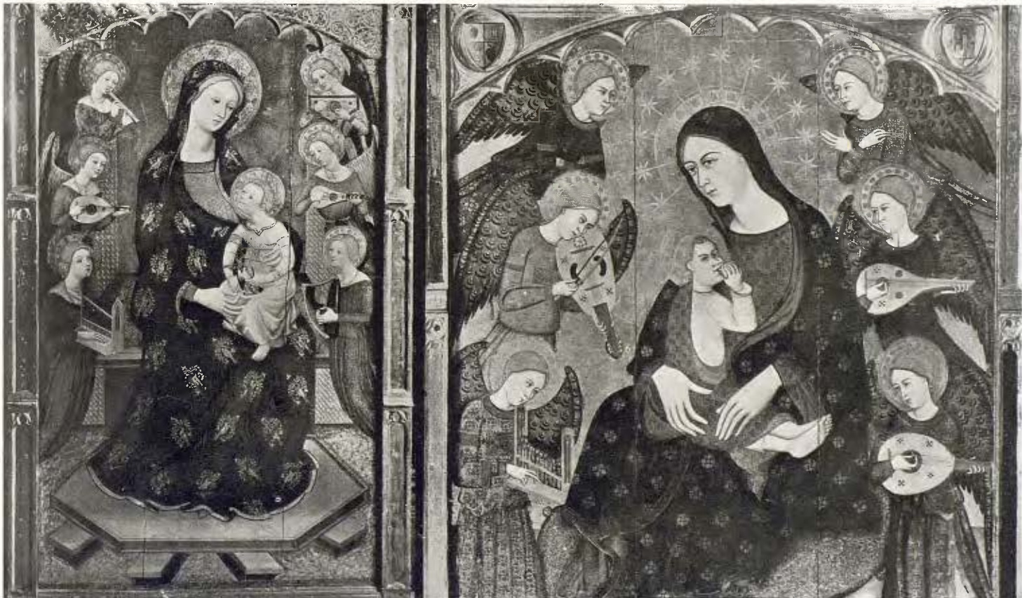
La Mare de Déu amb el Fillet i àngels; taula gòtica d'En Pere Serra - Darreries del segle XIV 35