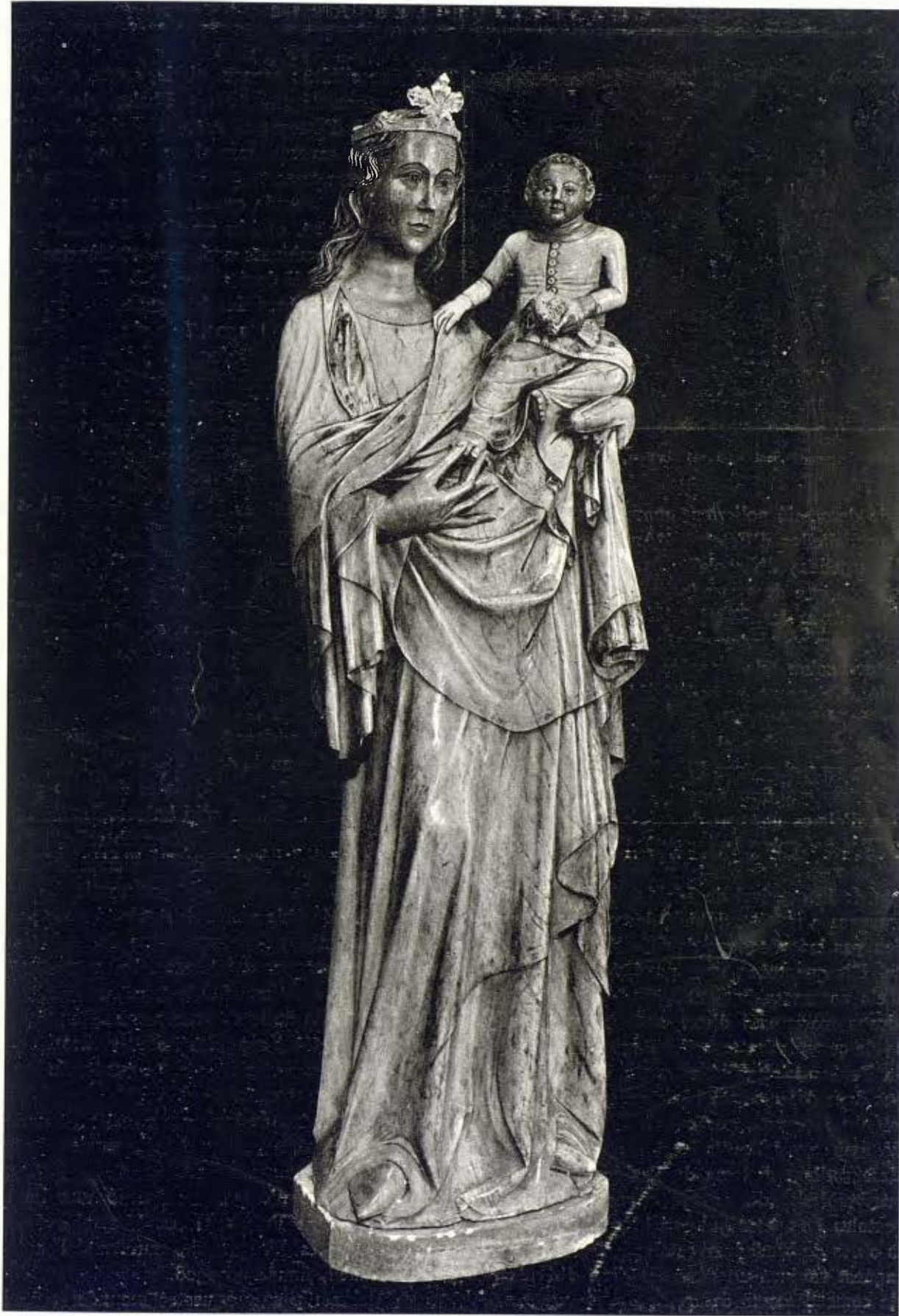
Image de la Mare de Déu, en alabâtre - Siècle XIV