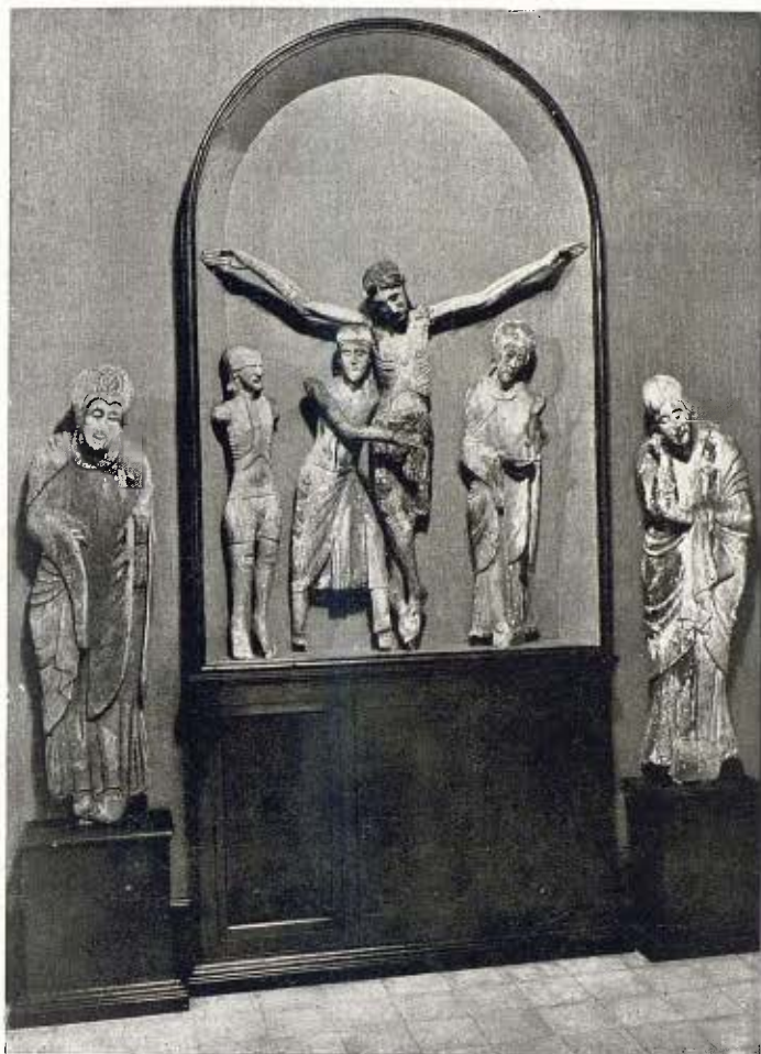
Part de dos Davallaments en fusta tallada - Segle XIII