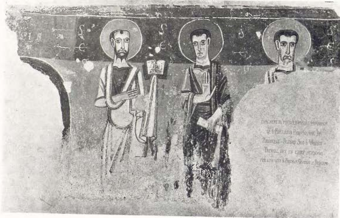
Pintura mural romànica d'Argollell - Segle XII

Cinc són els retaules conservant la disposició primitiva, característica de la tretzena i catorzena centúria. El més antic està dedicat a Santa Ursula, la verge i màrtir colonyesa, cabdill de les onze mil donzelles que la seguïren en la defensa de la virginitat i el vessament de la sang llur. Pertany ja al segle XIV el conegut retaule, procedent de la catedral d'Osca i dedicat als Sans Apòstols Jaume i Andreu, que per les indicacions heràldiques deuria datar-se entre els anys 1329 i 1334, essent donació de la Infanta Elionor de Castella i de son marit Alfons IV, rei d'Aragó i comte d'Urgell. Li són poc posteriors l'empordanès de Sant Tomàs Apòstol i l'incomplet, provinent de Caralps, en què la iconografia eucarística s'espandeix fins a presentar materials contra els jueus i llurs atribuïdes abominacions i sacrilegis. El darrer d'aquests retaules, consagrat a Sant Cristòfor, és una mostra