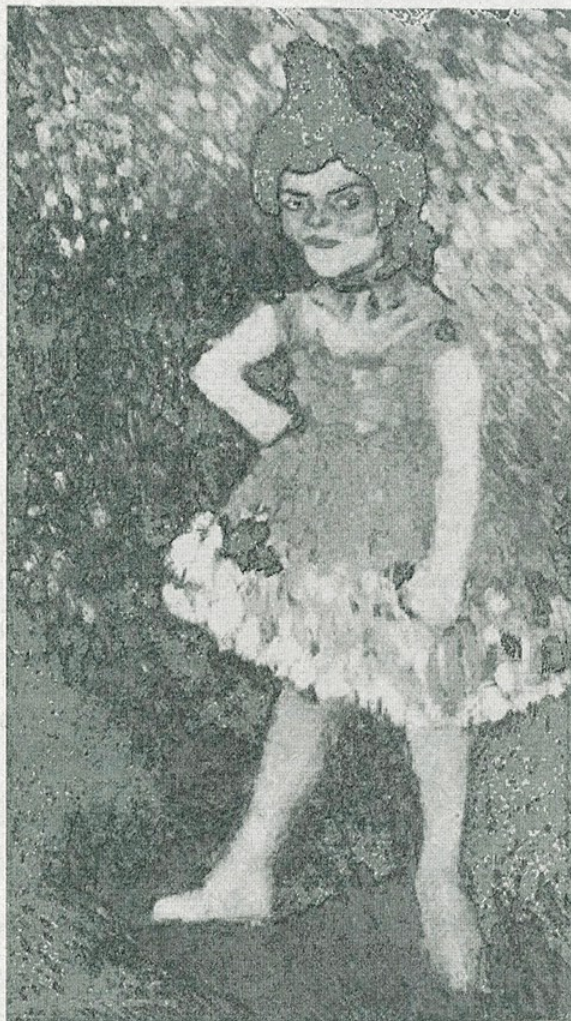
✓ P. R. Picasso. — «Ballarina nana» (Museu d'Art de Catalunya)

cia de l'escultura negra, cubisme, pompeianisme, sobrerrealisme, etc.); assenyalaran, amb més o menys possible precisió, les dates entre les quals s'inclou cada