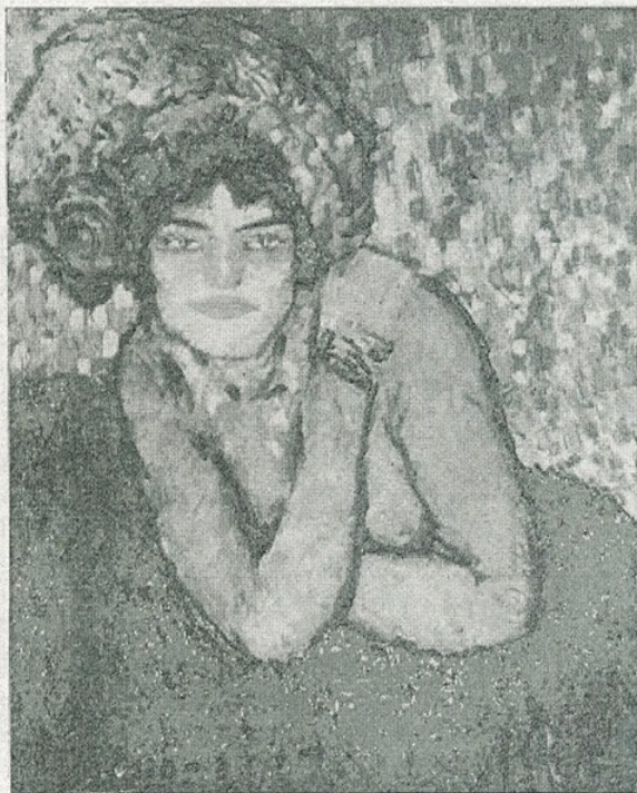
✓ P. R. Picasso. — «Margot» (Museu d'Art de Catalunya) MPB 4271