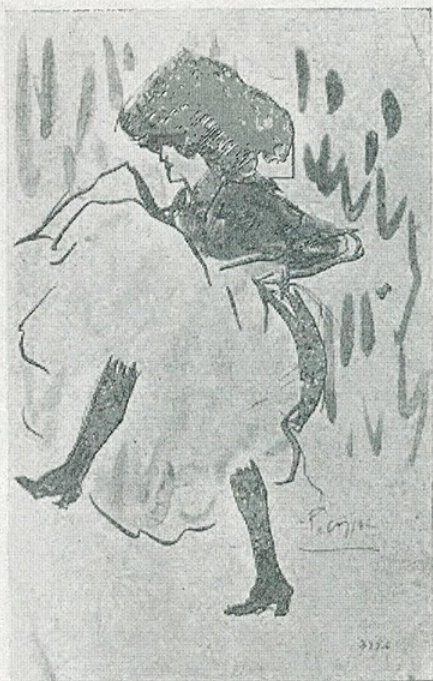
✓ P. R. Picasso. — «Dibuix» (Museu d'Art de Catalunya) mpB 4774