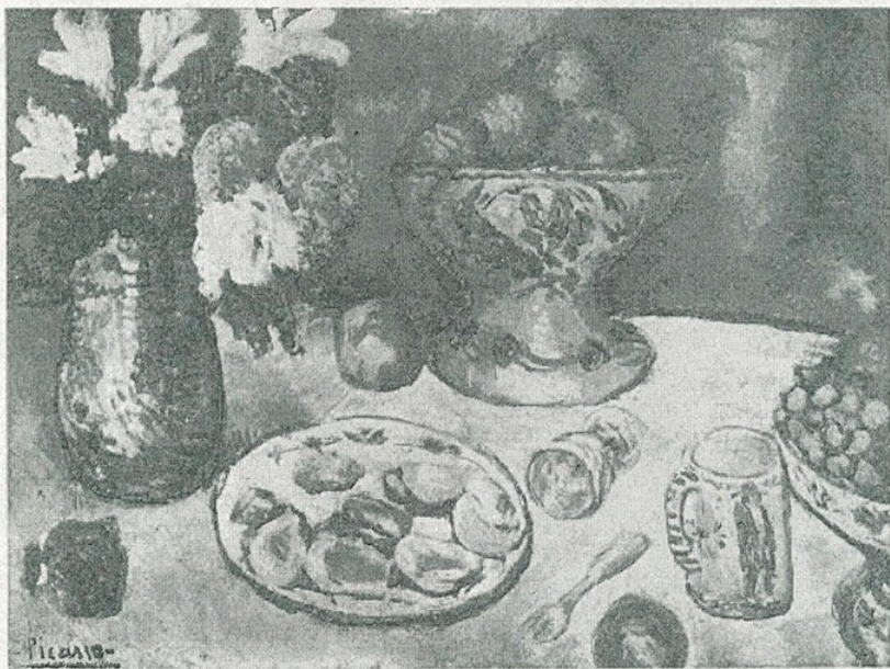
✓ P. R. Picasso. — «Bodegón» (Museu d'Art de Catalunya)

pintar de Picasso, cal convenir que les obres d'aquest al Museu de Barcelona són de les més estrictament pictòriques, de les menys contaminades per influències alienes a la pintura. Tant l'esmentat Retrat , com l' Arlequí (1) — prototipus d'un motiu que el pintor havia també d'explotar segons els canons cubistes —, com la Ballerina nana , com Maternitat , com Margot , com el Retrat del pintor Sebastià Junyer (pertanyent a la famosa «època blava»),