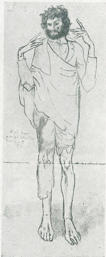
✓ P. R. Picasso. — «Dibuix en blau» (Museu d'Art de Catalunya)

No es poden hipotecar els judicis de l'esdevenidor; però — i això no passa d'ésser, com ho és al capdavant tota crítica, una opinió personal, que no som sols a