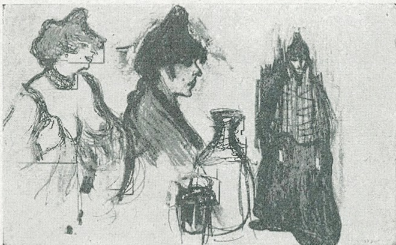
✓ P. R. Picasso. — «Apunts» (Museu d'Art de Catalunya) MP13 4776