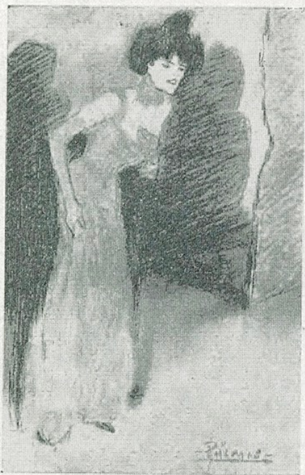
✓ P. R. Picasso. — «Vedette» (Museu d'Art de Catalunya)