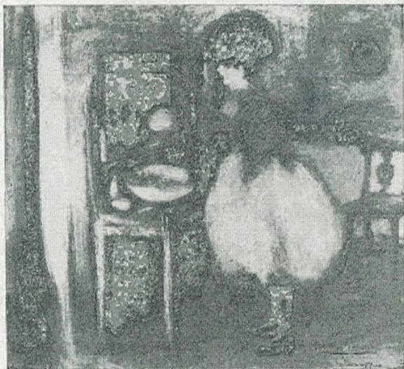
✓ P. R. Picasso. — «Artista en el camerino» (Museu d'Art de Catalunya) mpB 4275