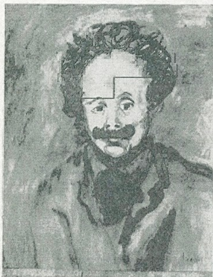
✓ P. R. Picasso. — «Retrat del pintor Sebastià Junyers» (Museu d'Art de Catalunya)