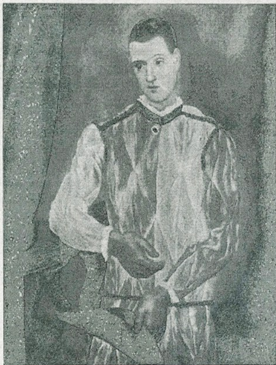
✓ P. R. Picasso. — «Arlequin» (Museu d'Art de Catalunya)

D'altra banda, en la major part de teoritzadors de l'art dit modern existeix una confusió constant entre el punt de vista del creador i el punt de vista de l'espectador. El crític pretén analitzar, no l'obra que té al davant, sinó el procés de crea-