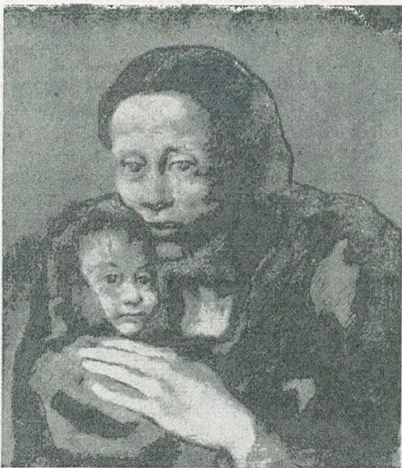
✓ P. R. Picasso. — «Maternitat» (Museu d'Art de Catalunya) MP13 4269