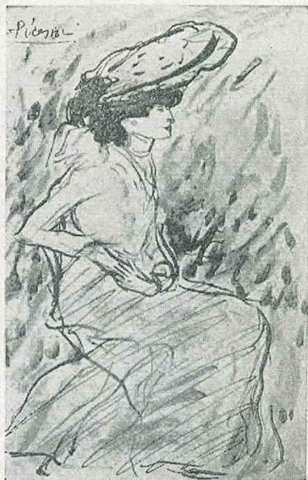
✓ P. R. Picasso. — «Dibuix» (Museu d'Art de Catalunya)