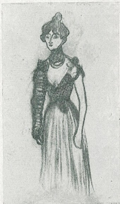
✓ P. R. Picasso. — «Dibuix» (Museu d'Art de Catalunya) mpB 4777