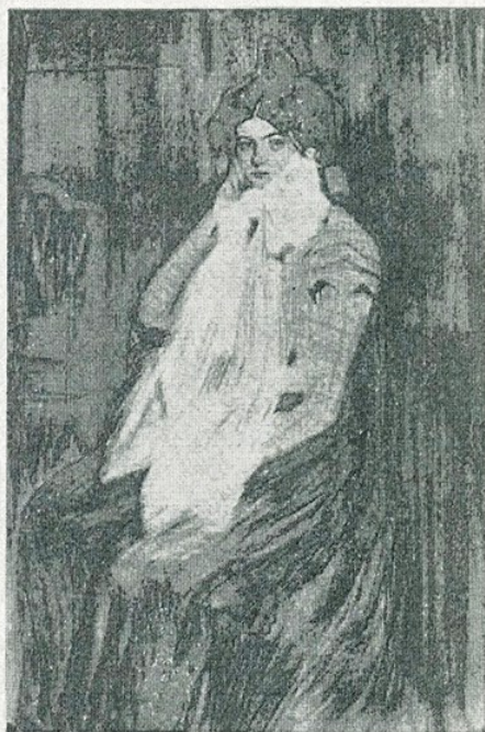
✓ P. R. Picasso. — «Lola» (Museu d'Art de Catalunya) MPB 4265