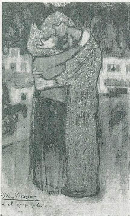
✓ P. R. Picasso. — «Apache» (Museu d'Art de Catalunya) MPB 4263