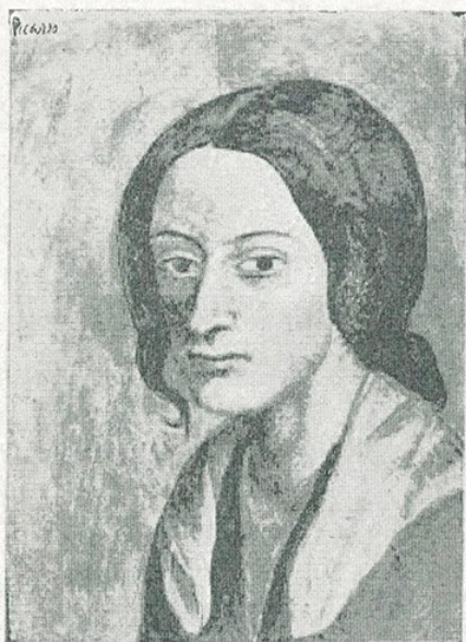
✓ P. R. Picasso. — «Cap de dona» (Museu d'Art de Catalunya)