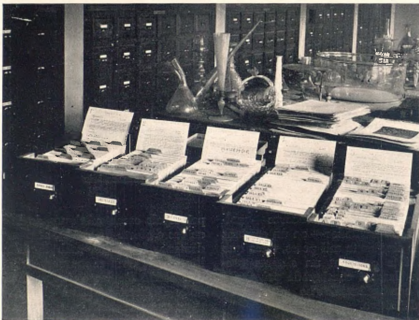
Diversos calaixos de les cinc sèries de fixers instal·lats a les oficines tècniques

Sempre, però, es té cura que els números siguin de petit tamany, clars i situats en un indret amagat o discret, ensems que fàcils de trobar en tot moment. En pintures, dibuixos i altres objectes de superfície plana, el número està escrit a l'angle dret inferior; en escultures, bronzes, ceràmica, vidres i, en general, totes