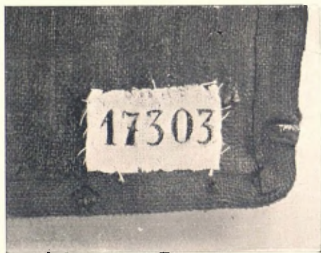
Peça d'indumentària i detall amb el seu número d'inventari

d'objectes ha augmentat en quantitat i qualitat. El que avui constitueix el fons de la Junta de Museus ja no és aquell heterogeni conjunt que s'exposava al Museu de la Ciutadella, en el vell parc barceloní. En molt poc temps l'ingrés d'obres al Museu ha estat abundant, extraordinari. A més de l'adquisició de les col·leccions Plandiura i Bosch i Catarineu (1) cal anotar els importants i quantiosos llegats (Fàbregas, Artigas-Alart, Roig i Raventós), donatius (Rocamora, Coll, Marquesa de Cornellà, Vallmitjana, etc.), i dipòsits (Mateu, Masriera, Ricard Torres, Col·legi de