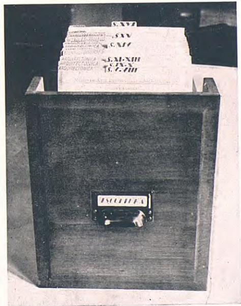
Un dels calaixos de l'arxivador de fitxes

Davant la possessió d'aquest valuós i quantios material i en l'avinentsa de procedir-se a l'organització dels serveis tècnics dels Museus, la Junta va entendre que en aquests serveis interessava que hi hagués el de l'Arxiu de Clixés fotogràfics.