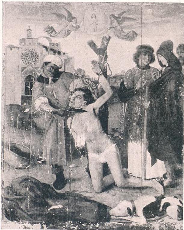
Anvers d'una fitxa

La formació d'aquest Arxiu es va començar reunint tots els clixés que fins aleshores havia impressionat el laboratori fotogràfic dels Museus i els procedents de la secció d'«El Arte en España» de l'Exposició de Barcelona.