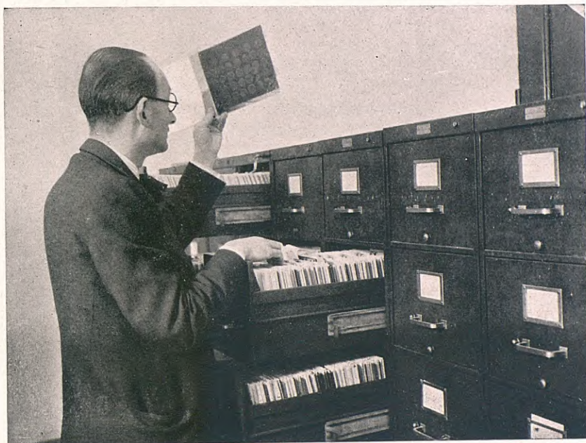
Els arxivadors de clixés

Els números relatius a clixés que hi ha en la fitxa, és a dir, els escrits en tinta