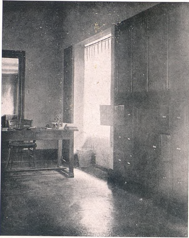
L'arxivador de fitxes