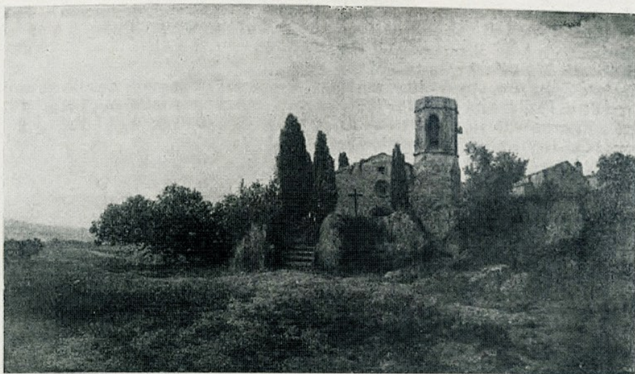
Modest Urgell. — « El toc d'oració »