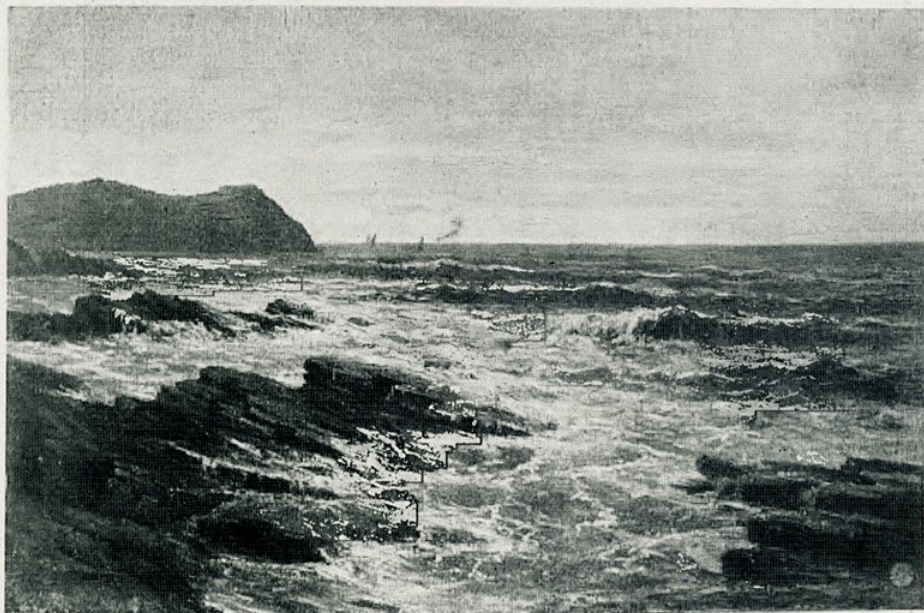
C. Häes. — « Marina »