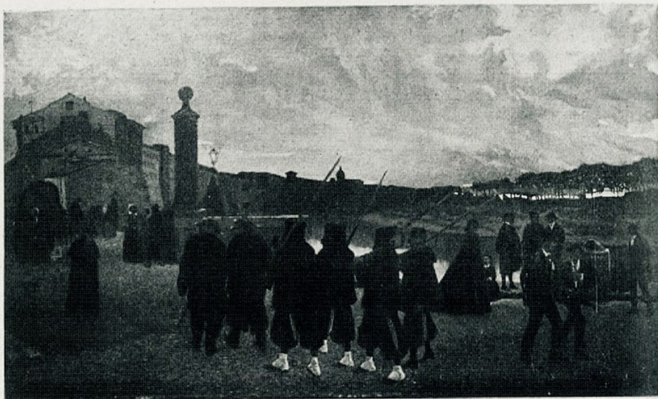
J. Ll. Pellicer. — «Zitto silenzio che passa la ronda»

8- Del pintor portuguès Roc Gameiro és una aquarella retolada Rio dos masos . Mideix 0'54 \times 0'38 , i amb passee-partout 0'76 \times 0'60 metres, i té marc de caoba.